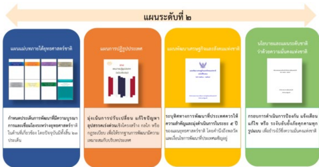
รูปที่ 3 การเชื่อมโยงนโยบายและแผนระดับชาติ (แผนระดับที่ 2)