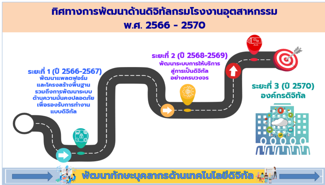
รูปที่ 9 ทิศทางการพัฒนาเทคโนโลยีดิจิทัลของกรมโรงงานอุตสาหกรรม (พ.ศ. 2566 - 2570)