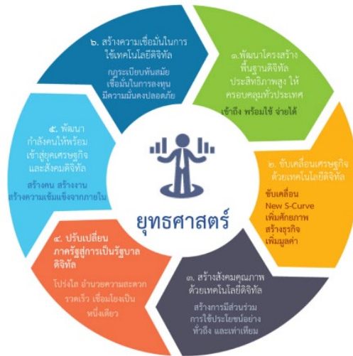
รูปที่ 5 ยุทธศาสตร์การพัฒนาดิจิทัลเพื่อเศรษฐกิจและสังคม

โดยจะขอกล่าวถึงยุทธศาสตร์หลักที่เกี่ยวข้องกับกรมโรงงานอุตสาหกรรมดังนี้