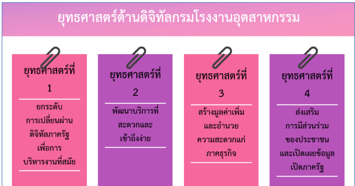
รูปที่ 10 ยุทธศาสตร์ด้านดิจิทัลของกรมโรงงานอุตสาหกรรม (ปี พ.ศ. 2566 - 2570)

กรมโรงงานอุตสาหกรรมได้กำหนดยุทธศาสตร์ด้านดิจิทัล (ปี พ.ศ. 2566 - 2570) ไว้ 4 ยุทธศาสตร์ดังนี้