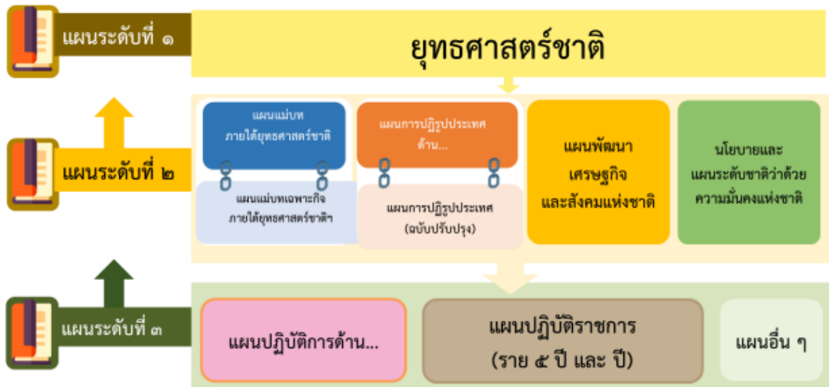
รูปที่ 1 การเชื่อมโยงกับนโยบายและแผนระดับชาติที่เกี่ยวข้อง

ความสอดคล้องเชื่อมโยงกับนโยบายและแผนระดับชาติระดับต่าง ๆ